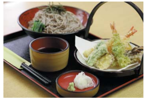
サクッと揚げた天ぷらとコシのある蕎麦が相性バツグン! 天ぷらざるそば 800円