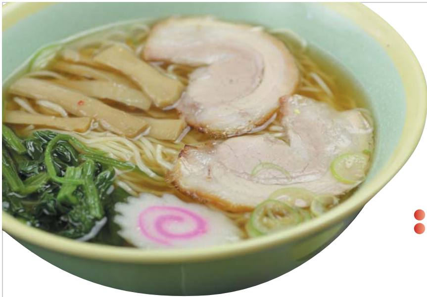
鶏ガラベースのあっさりとした醤油ラーメン 500円