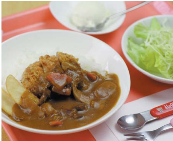
カツカレーに大満足! お子様カレーセット(デザート・おまけ付) 600円