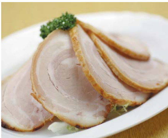
ビールのお供に肉厚なチャーシュー 400円