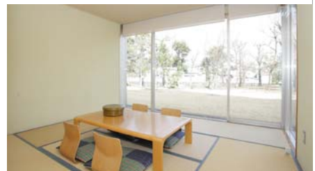
ご家族でゆったり時間をお過ごしいただけます