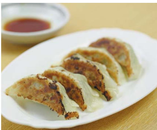
モチリな皮にジューシーな具を包んだ 焼餃子 380円