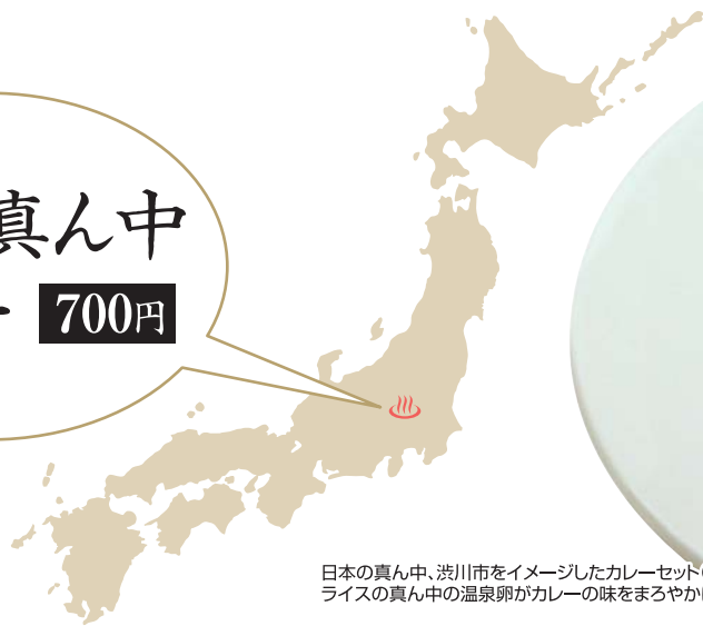
日本の真ん中、渋川市をイメージしたカレーセット (サラダ付) ライスの真ん中の温泉卵がカレーの味をまろやかに。700円