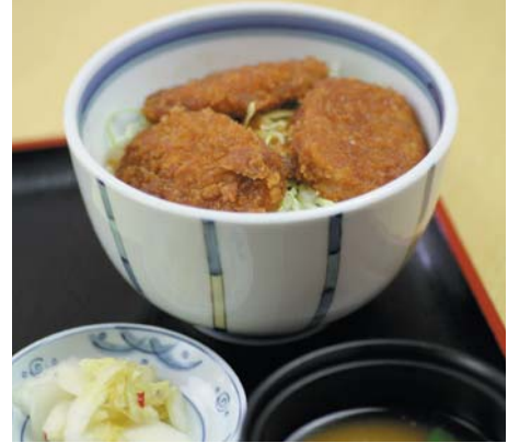
ソースカツ井定食 (味噌汁・漬物付) 900円