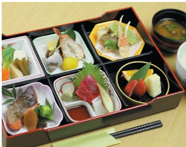
四季の彩り豊かです。旬な食材を盛り込んだ松花堂弁当 (写真はイメージ、食材により料理内容は異なります)