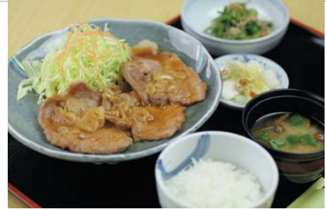
生姜焼き定食 (味噌汁・漬物付) 800円