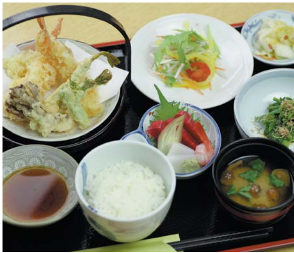
団体利用の際には 赤城御膳(天ぷら・刺身・味噌汁・漬物・おひたし) 1,500円