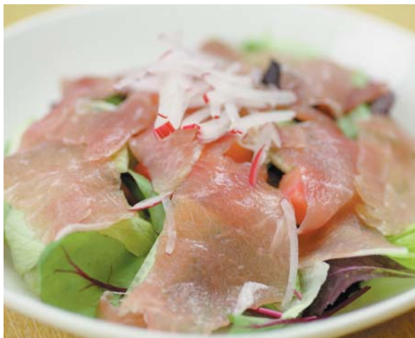
オリジナルドレッシングで味が引き立つ 生ハムサラダ 550円