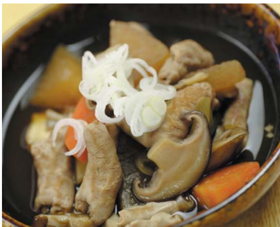
モツと野菜が盛りだくさん!もつ煮 400円