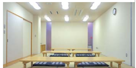
大小の宴会や法事の際にご利用ください